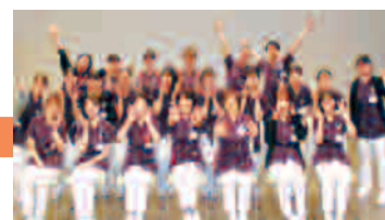
新人看護師臨床研修終了