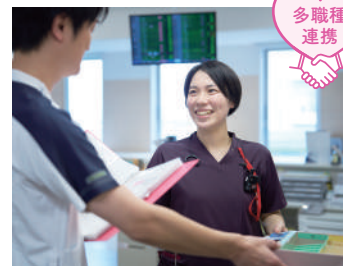
お昼前の投薬準備